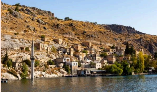
Batık şehir Halfeti