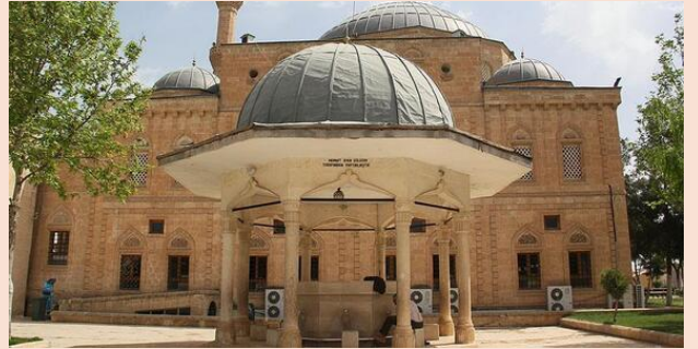
Eyyüp Peygamber ve Makamı