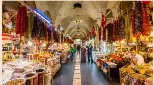
Bayazhan Gaziantep Kent Müzesi