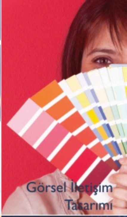
Görsel İletişim Tasarımı