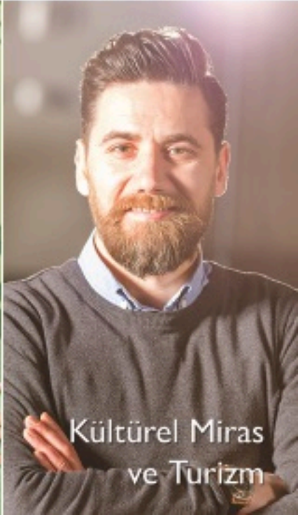
Kültürel Miras ve Turizm