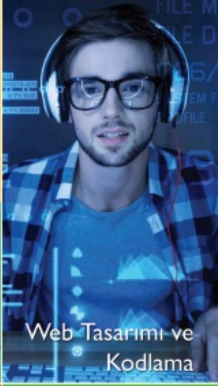
Web Tasarımı ve Kodlama