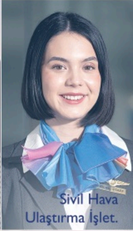
Sivil Hava Ulaştırma İşlet.