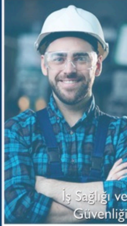
İş Sağlığı ve Güvenliği