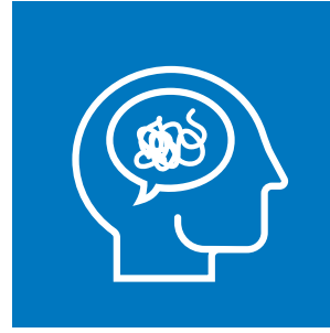
Eko-anksiyetenin Eğitim Çalışmalarına Etkisi