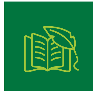
Edebiyatın Çevre Eğitimindeki Rolü