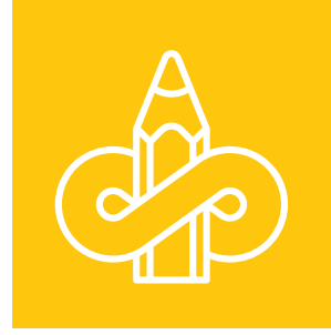
Yetişkinler için Çevre Eğitimi- Yaşam Boyu Öğrenme