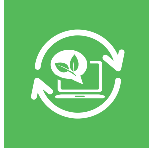
Sürdürülebilir Gelecek için Yeni Teknolojiler