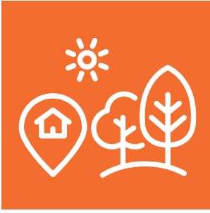
Yerel Yönetimler ve Çevre Eğitimi