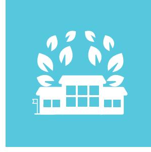
Okullarda Çevre Eğitimi Farkındalık Uygulamaları