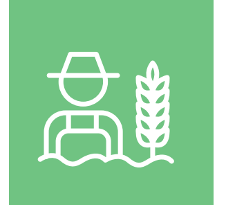
Çevre Eğitiminin Yaygınlaştırılması