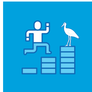
Başarının Ölçülmesi: Çevre Eğitimi Programlarının Etkinliğinin Değerlendirilmesi