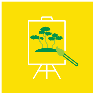
Sanatın Çevre Eğitimindeki Rolü