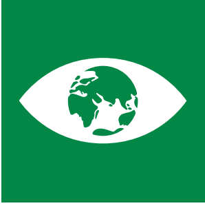
İklim Değişikliği ve Uyum Eğitimi