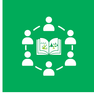
Toplumda Çevre Okuryazarlığı