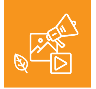
Medya ve Çevre Eğitimi