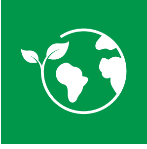
Çevre Eğitiminde Uluslararası Yaklaşımlar